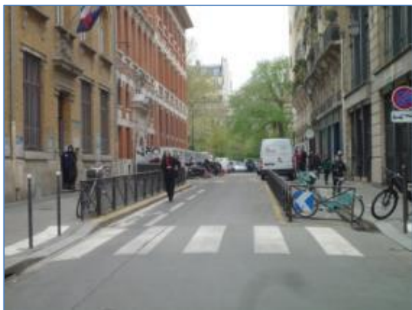
Rue Paul Dubois