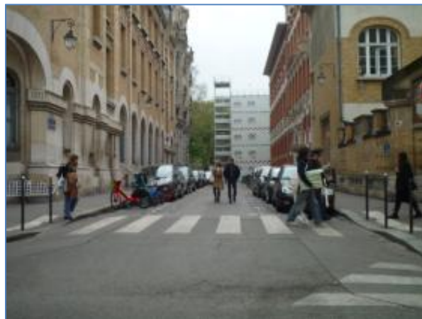
Rue Gabriel Vicaire